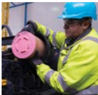
Регламентное техническое обслуживание