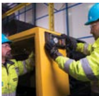
Восстановление внешнего вида