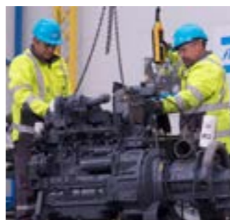
Замена двигателя (3)