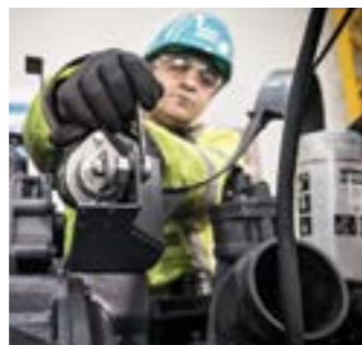
Запчасти и услуги