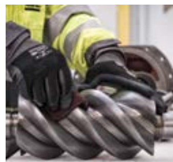
Капитальный ремонт винтового элемента (1)