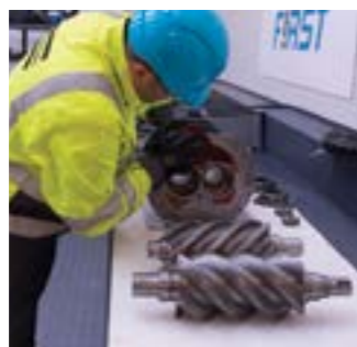
Замена винтового элемента (2)