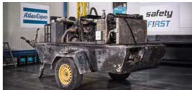
Требуется капитальный ремонт