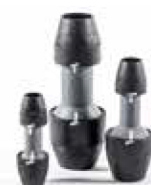
Белые индикаторы момента затяжки (серия PF)