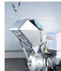
ИСПОЛНЕНИЕ СО СКИПОМ/ СКРЕПЕРОМ