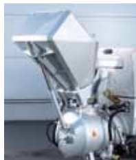
ИСПОЛНЕНИЕ СО СКИПОМ